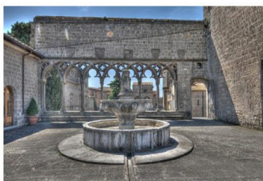
Viterbo - Palazzo dei Papi