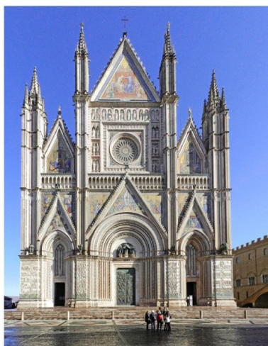
Orvieto - Il Duomo